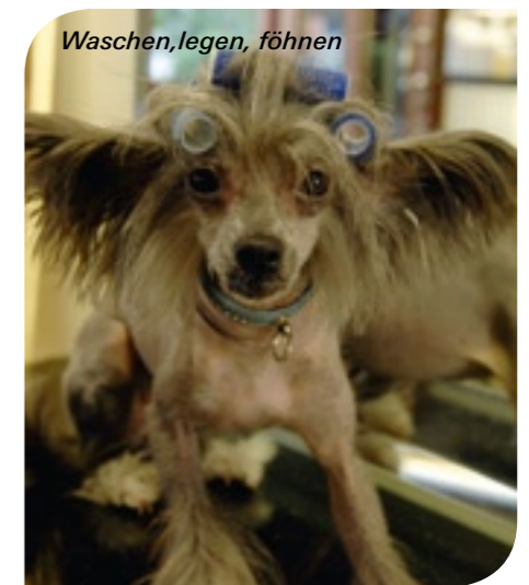
Waschen, legen, föhnen

Eine Flasche des Jojoba Hundeshampoo-konzentrats auf Edellipidbasis enthält 200 ml, entspricht einem Liter Shampoo. Wie bei all ihren Produkten spendet Mahnaz auch beim Hundeshampoo einen Euro des Verkaufspreises